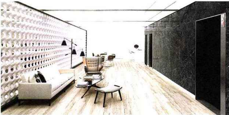
WICANDERS: Sol vinylique Authentica avec sous couche en liège à isolation thermique www.wicanders.com