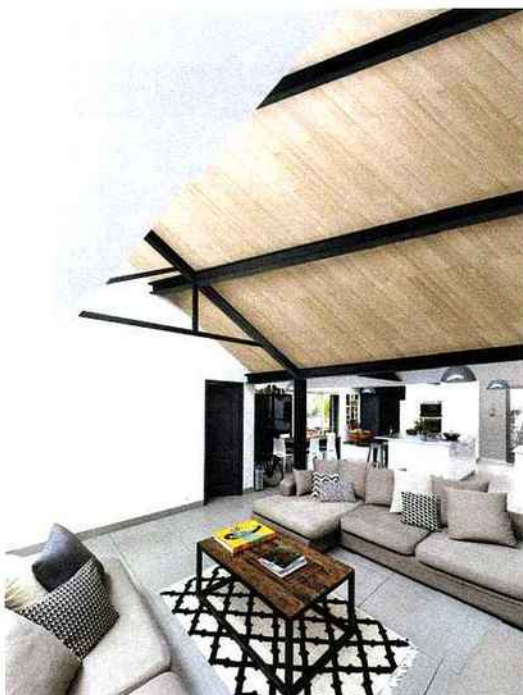
UNILIN INSULATION: Trilatte 3D www.unilininsulation.com