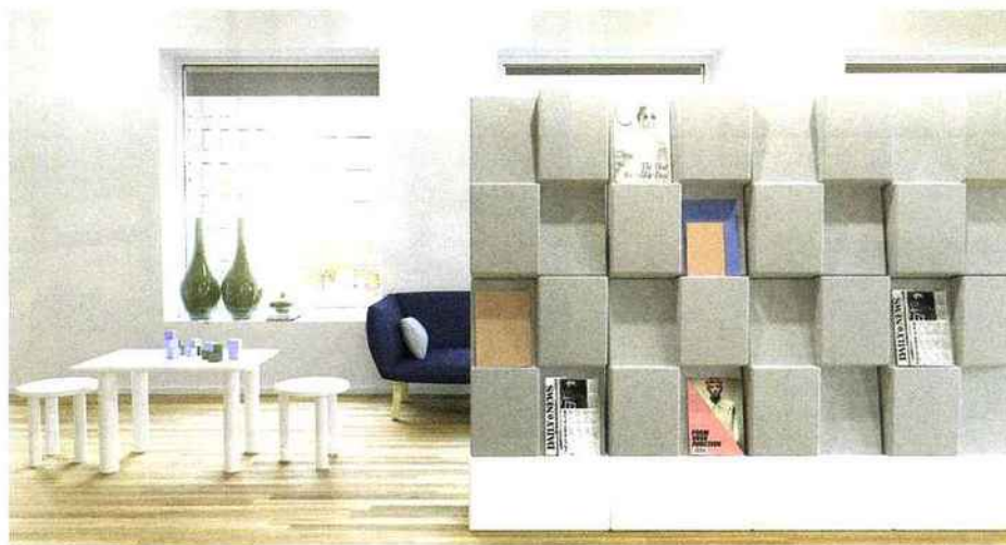
ABSTRACTA: Mur d'absorption sonore WINDOW www.abstracta.se