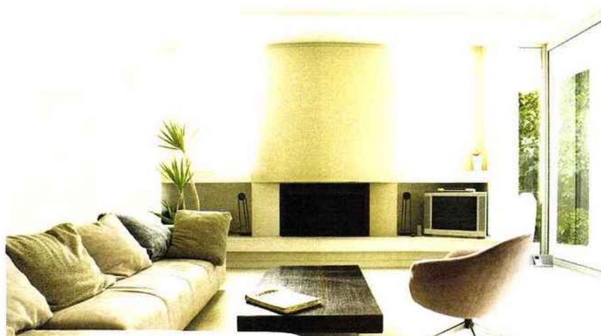
SYSTEXX BY VITRULAN: Revêtement SYSTEXX AcousTherm classe d'absorption acoustique E www.systexx.com