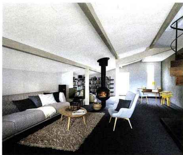
UNILIN INSULATION: Caisson chevrons Trilate pour l'isolation www.unilininsulation.com