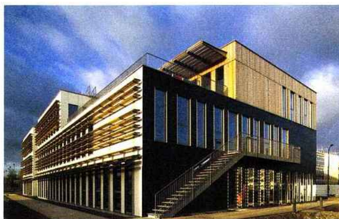
GCEB : Isolation thermique, Villeneuve-d'Ascq www.gceb.info