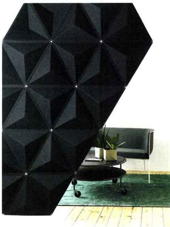
ABSTRACTA : Partition murale d'absorption sonore AIRCONE www.abstracta.se