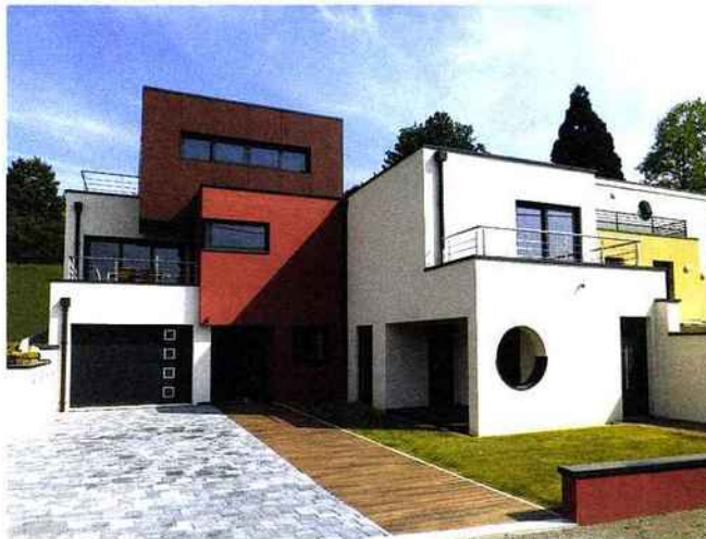
EUROMAC 2: Dalles, blocs et panneau de toiture coffrant, isolation thermique et acoustique www.euromac2.com