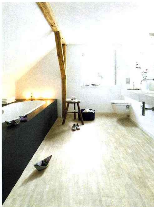
WICANDERS : Sol en liège étanche Hydrocork à résistance thermique et acoustique, technologie Corktech www.wicanders.com