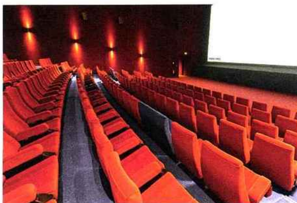
SINIAT : Cloison Prégymétal Sinemax 500 - EI60 - 76 DB www.siniat.fr