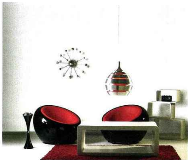
SYSTEXX BY VITRULAN : Revêtement SYSTEXX Acoustic classe d'absorption acoustique E www.systexx.com