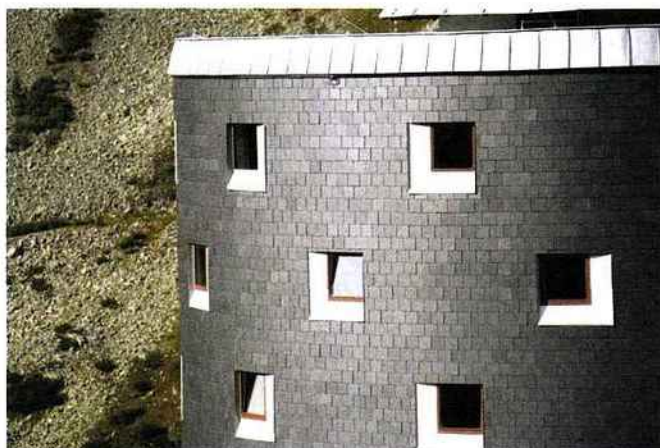
FPAN: Facades en ardoise naturelle: solution pérenne, efficiente et compétitive pour l'enveloppe des bâtiments. © FPAN (Fédération des Professionnels de l'Ardoise Naturelle). www.ardoisenaturelle.fr