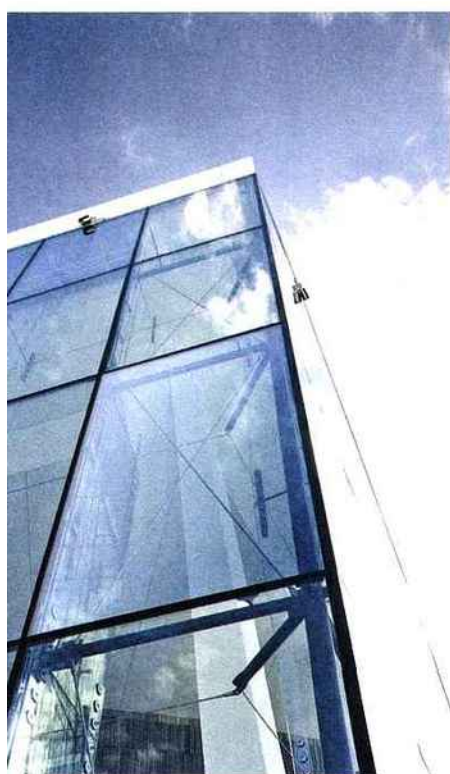
ACC : Stopray Smart 51 33, vitrage à contrôle solaire et isolation thermique élevés www.agc-glass.eu