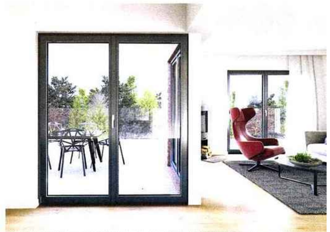
OKNOPLAST: Fenêtre Pixel à double ou triple vitrage thermique avec remplissage argon www.oknoplast.fr