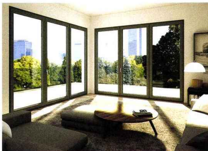
OKNOPLAST : Vitrage Winergetic 4XGlass à isolation thermique et acoustique www.oknoplast.fr