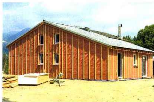
SINIAT : Pose du système AQUABOARD SINIAT sur une maison individuelle à ossature bois. www.siniat.fr